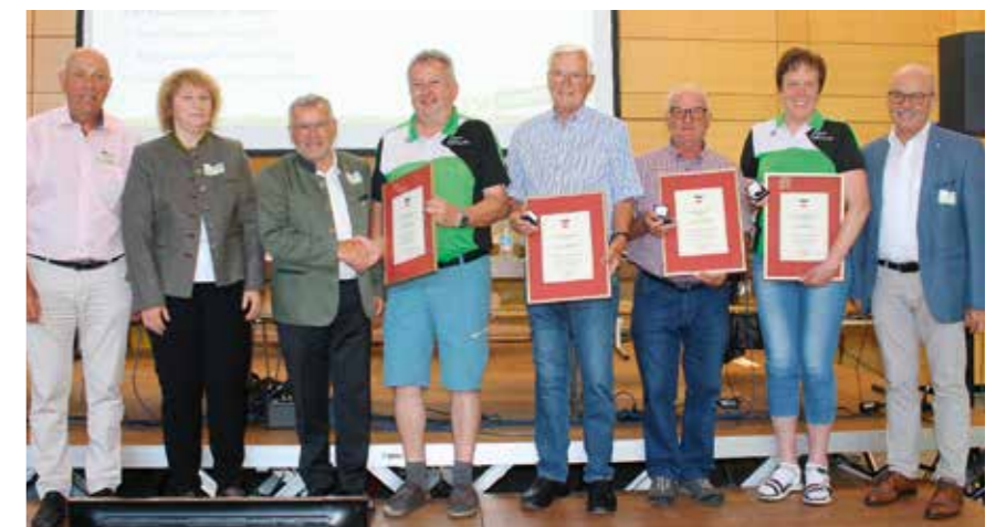
Das neu zusammengesetzte Präsidium mit den ausgezeichneten TrägerInnen des Goldenen Ehrenzeichens