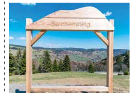
Holzportal Belchensteig beim Wiedener Eck