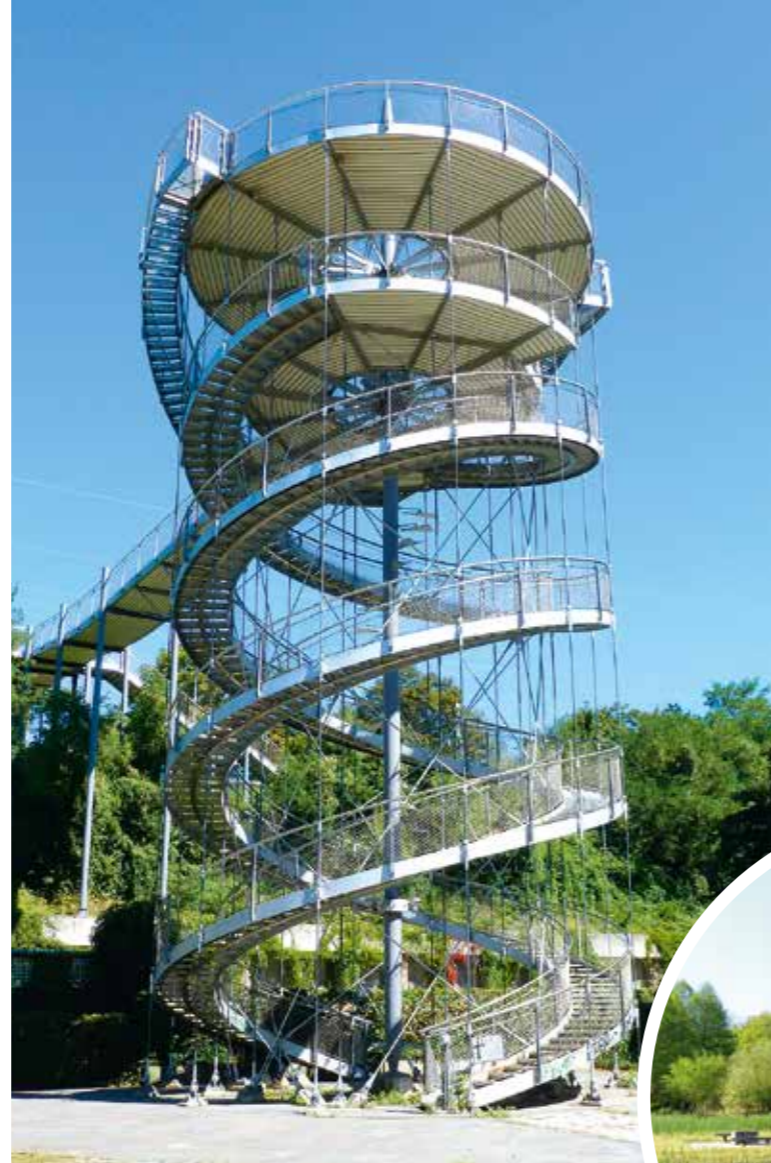
Schlaichturm und Skulptur im Dreiländergarten (rechts)