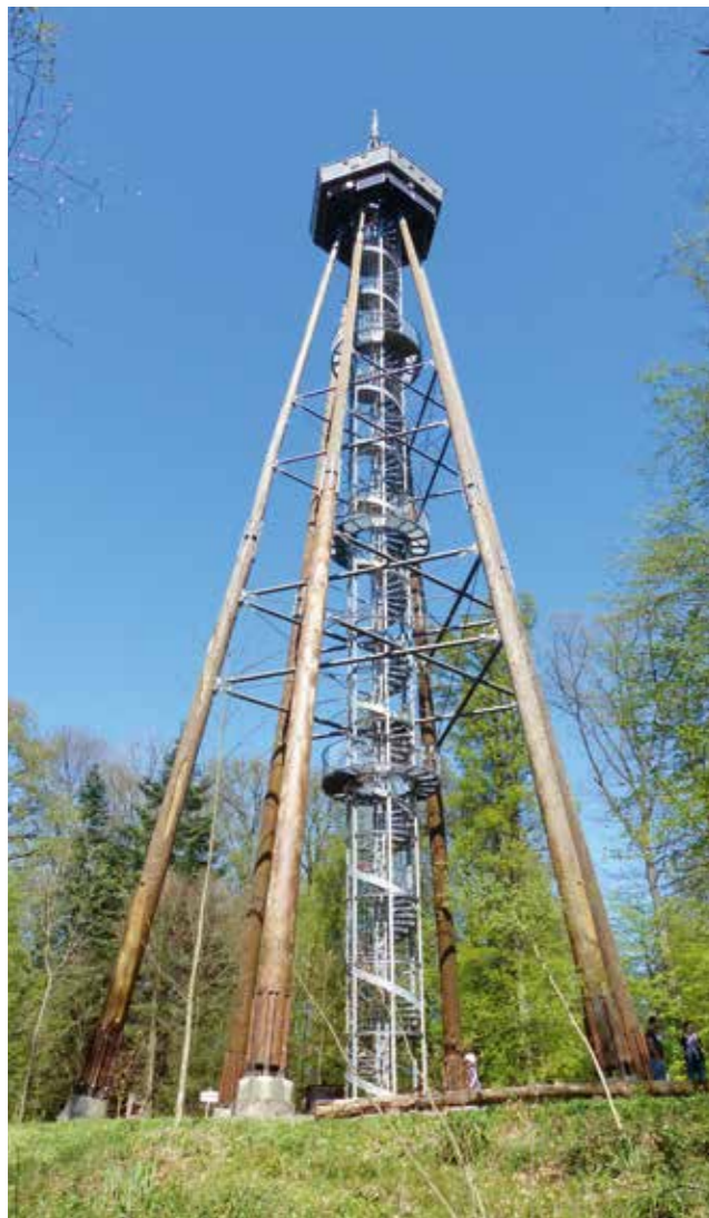
Der Eichbergturm bei Emmendingen ist mit 53,20 Metern der höchste frei zugängliche Turm Deutschlands.

Die Türme waren allerdings nicht bei jedem beliebt. Natur- und Heimatschützer kämpften gegen den Bau vieler Türme, die sie als bauwerkliches Unkraut bezeichneten, das auf den Höhen der Schwarzwaldberge wuchert. Dennoch wurden bis kurz vor dem Zweiten Weltkrieg insgesamt 107 Türme gebaut, davon errichtete allein der Schwarzwaldverein 63. Alte Vermessungs-, Wasser- und Wachtürme wurden umfunktioniert und einige Aussichtshütten zu Türmen umgebaut oder neu errichtet. In der Nähe der Türme entstanden auch Gasthäuser, die teilweise noch heute fürs leibliche Wohl sorgen. Die Türme waren damals reine Holz-, Stein- oder Metalltürme. Eine Mischung der Materialien war eher selten. So ist beispielsweise der Blauturm auf dem Hochblauen südöstlich von Badenweiler 1895 als reiner Eisenturm errichtet worden. Weitere Aussichtstürme aus Eisen sind der Hohe-Horn-Turm bei Offenburg, der Büchenbronnerhöhe-Turm bei Pforzheim, der Rosskopfturm bei Freiburg und der Aussichtsturm in Dürrenmettsetten. Schöne Beispiele für Steintürme sind