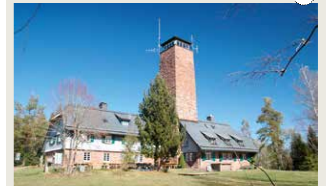
Der Turm: Fohrenbühl 12, Lauterbach, Tel. 07422 44 61

pen der ehemals getrennten Länder zur Erinnerung aufgestellt. Nebenbei bemerkt steht das Gedächtnishaus auch als Symbol für die Vereinigung der badischen und württembergischen Schwarzwaldvereine in den 1930er-Jahren des letzten Jahrhunderts.