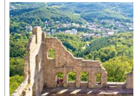
Blick über Baden-Baden vom Alten Schloss