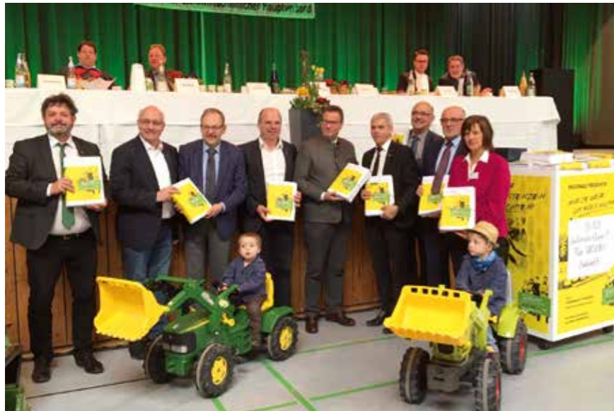
Der bäuerliche Nachwuchs brachte die Unterschriften.

Die Teilnehmer an der diesjährigen Landesversammlung des BLHV haben am 7. Februar 2020 einen vielleicht ganz besonderen Tag erlebt. Diese Veranstaltung könnte zur Geburtsstunde einer neuen basis-demokratischen Kultur werden.