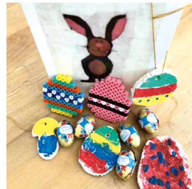
Osterpaket der Familie Hassinger, Schwarzwaldverein Waldbronn (weitere Ostergröße finden Sie unter www.schwarzwaldverein.de )