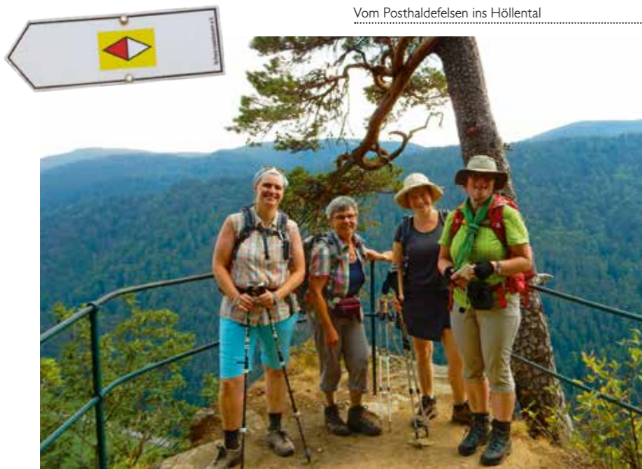
Vom Posthaldefelsen ins Höllental