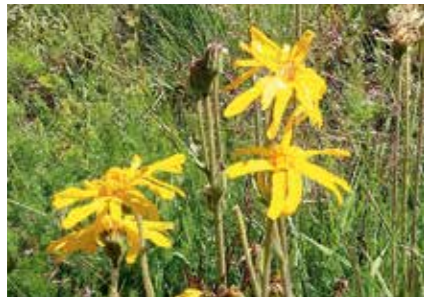
Arnika auf Borstgrasrasen im Simonswälder Tal

Klimawandel erfordert dynamische Naturschutzkonzepte