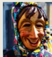
Auf der Bure-Fasnet in Sulzburg