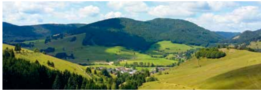
Klimawandel fordert einen stärkeren Fokus auf die Landschaft. Blick ins Hochtal von Bernau.

Der Südschwarzwald beherbergt viele naturschutzfachlich hochwertige Flächen. Diese Lebensräume geraten durch den Klimawandel unter Druck, mit teils massiven Auswirkungen für den Naturschutz.