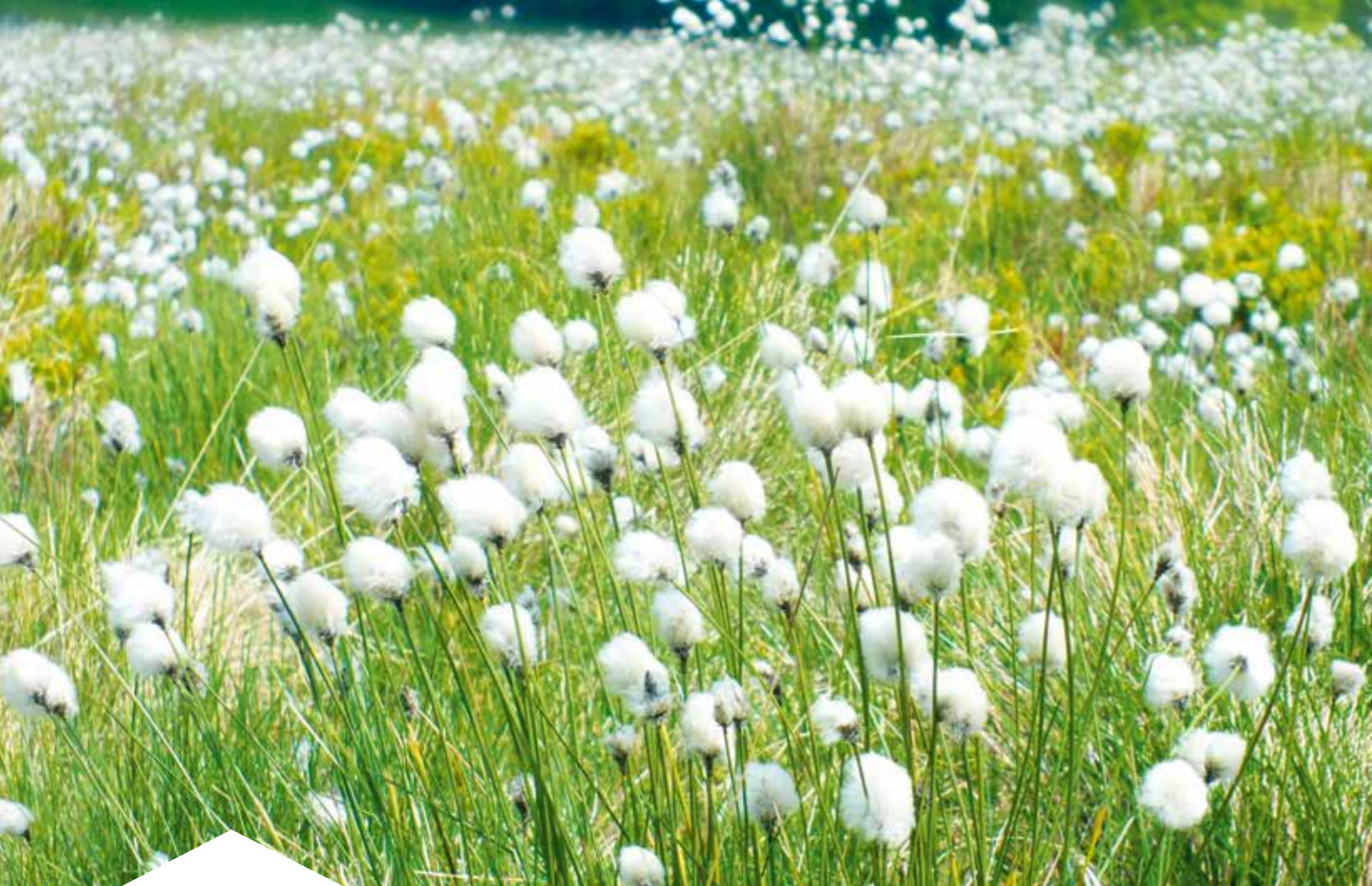
oben: Wollgras; unten: das Sumpfblytauge