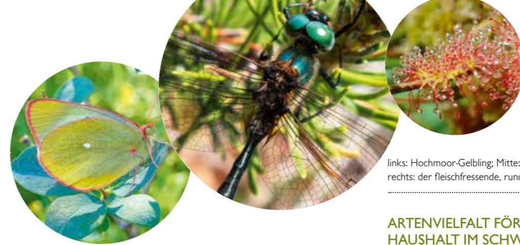
links: Hochmoor-Gelbling; Mitte: Arktische Smaragdlibelle; rechts: der fleischfressende, rundblättrige Sonnentau

Es handelt sich um einzigartige Biotop für seltene Pflanzen und Tiere, die in der Eiszeit noch weit verbreitet waren und hier ihre letzten Rückzugsräume finden. In von den Gletschern gebildeten Landschaften mit Karen, Moränen aus Steinen und Müssen konnten sich die nassen Lebensräume entwickeln. Wenn der Mensch sie lässt. Denn der Zustand vieler Moore ist durch historische Entwässerungsmaßnahmen schlecht. Die nassen Flächen wurden als unnützlich für die Land- und Forstwirtschaft angesehen. Tiefe Gräben treffen die jahrtausendealten Moore besonders hart. Wo das Wasser fehlt, überwachsen vielerorts Fichten die Moorpflanzen. Schmetterlinge wie der Hochmoor-Bläuling und Libellen wie die Arktische Smaragdlibelle finden dadurch immer weniger Platz und Torfmoose wachsen nicht mehr. Über zwei