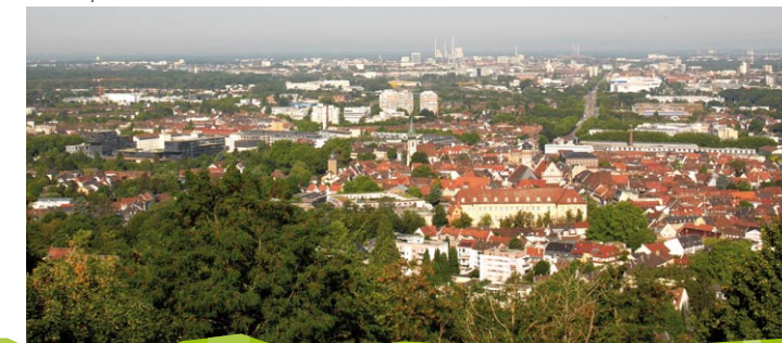
Blick auf Durlach

Vom Turmberg bietet sich bei klarem Wetter ein fantastischer Blick über Karlsruhe und die Rheinebene bis hin zum Pfälzerwald und den Vogesen. Die letzten Schritte nach Durlach führen über 528 Treppenstufen abwärts – bequemer lassen sich die letzten Meter mit der ältesten Standseilbahn Deutschlands, der Turmbergbahn zurücklegen.