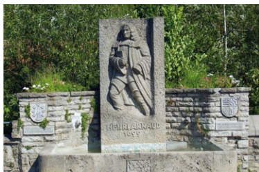
Henri-Arnaud-Brunnen in Dürrmenz

Kurz vor Überquerung der Autobahn sieht man die Waldschanze mit einem nachgebauten Wachturm, einer sogenannten