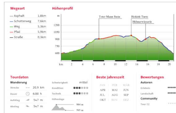
Abb.: Darstellung Höhenprofil und weitere Informationen im PDF-Ausdruck.

Das Höhenprofil gibt Auskunft über die Steigungen und den Wegebelag.