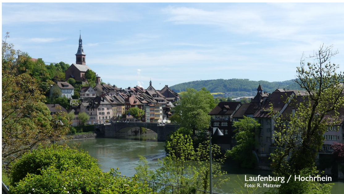
Laufenburg / Hochrhein