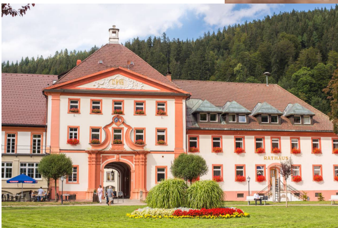
Rathaus St. Blasien