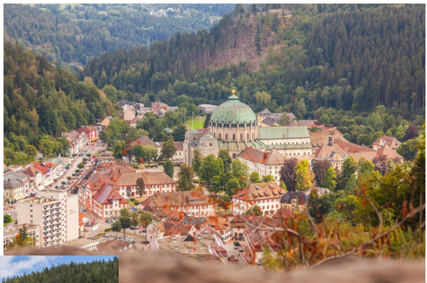
Blick auf St. Blasien