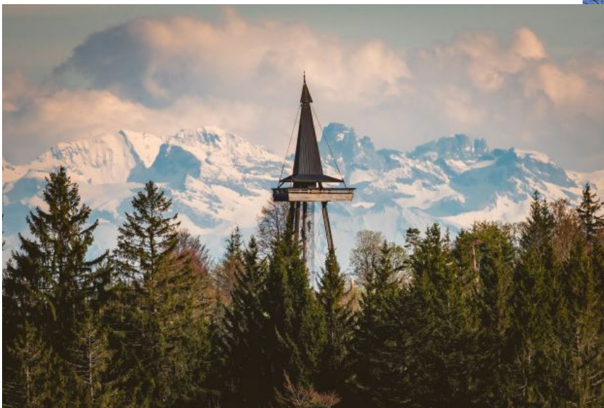
Gugelturm mit Alpenpanorama