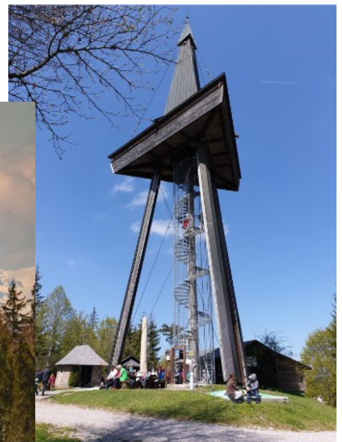
Rast am Gugelturm