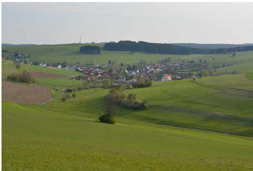
Blick auf Wellendingen