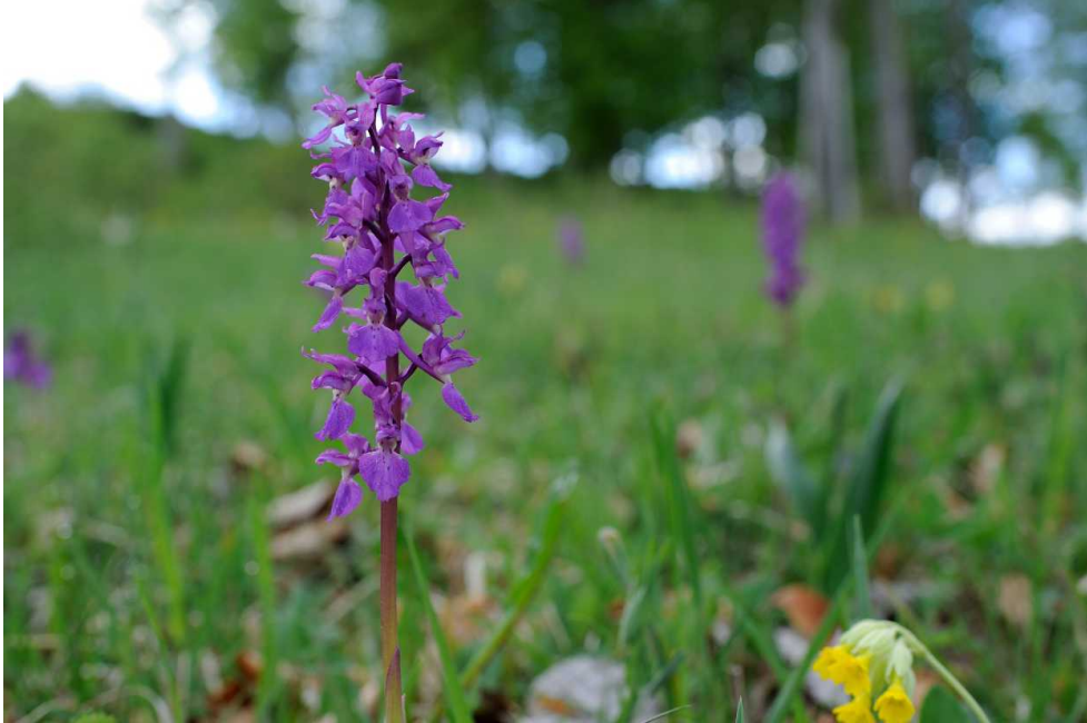
Knabenkrautblüte im Naturschutzgebiet Steppenheidehardt