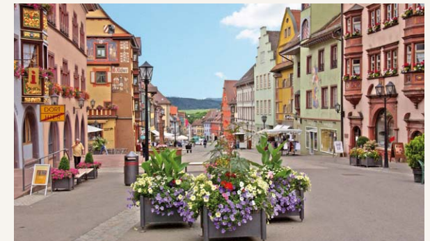
Hauptstraße in Rottweil, Foto: Tourist-Information Rottweil

Nachdem wir unser mitgebrachtes Rucksackvesper verzehrt haben, wandern wir auf einem Hangweg mit Ausblicken ins Eschachtal zum Rottweiler Ortsteil Bühlingen. Unser Ziel ist die historische Innenstadt von Rottweil. In der sehenswerten Fasnethochburg, die zugleich älteste Stadt Baden-Württembergs ist, erwartet uns ein einstündiger informativer Stadtrundgang.