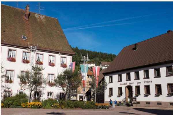
Marktplatz Furtwangen

Mit dem Bus des ÖPNV, bei dem wir angemeldet sind, fahren wir zurück nach Furtwangen.