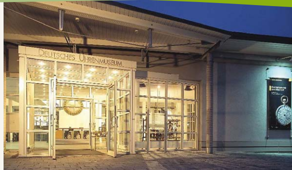
Deutsches Uhrenmuseum Furtwangen.